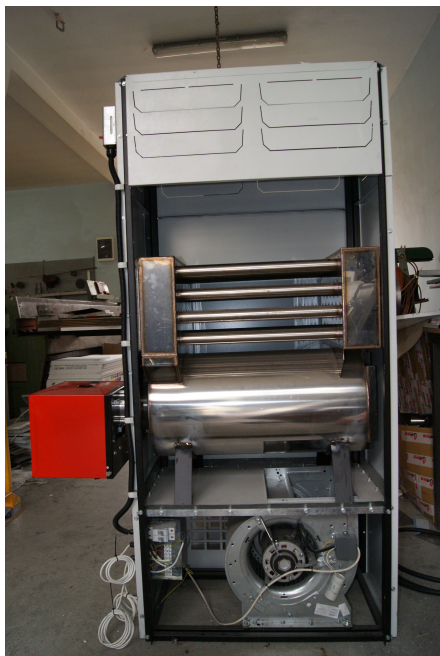
Schimbator de caldura din inox (vedere din interior, cu carcasa indepartata)

Arzatoarele folosite la aceste generatoare sunt Siemens Citerm si dispun de supraveghetor de flacara cu fotocelula.